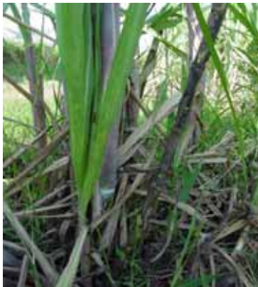
Figura 10. Tallos de caña de azúcar sin daño aparente por termitas CENGICAÑA

La termita subterránea Heterotermes tenuis (Isoptera: Rhinotermitidae) es una de las especies de termitas subterráneas más frecuentes y de mayor distribución en caña de azúcar en Brasil. Otras especies asociadas a caña de azúcar en Brasil son: Cornitermes cumulans , Neocapritermes opacus y Procornitermes triacifer (Arrigoni et al. , 1989). De acuerdo con Novaretti (1985), mencionado por Castiglioni y Vendramin (2003), cuando el ataque ocurre en la época de siembra, en el período de maduración y después del corte, pueden provocar pérdidas en la producción de hasta 10 Tm/ha/año. Prefieren maderas blandas como el pino y álamo que contengan de un 20 a 30 por ciento de humedad, pero al no encontrar su alimento favorito, pueden consumir otros tipos de maderas que incluyen árboles vivos y cultivos que contengan celulosa como la caña de azúcar. El daño en la siembra ocurre debido a la destrucción del tejido interno de los canutos que impide el desarrollo de raíces primordiales y las yemas. Se puede afectar cualquier parte de una macolla, sin embargo, hay cierta preferencia por los cogollos, brotes jóvenes y el sistema radicular. Al inicio los daños no son evidentes porque las macollas emiten nuevos brotes dentro de la macolla afectada (Figura 10), pero conforme avanza el desarrollo del cultivo, se incrementan tanto las macollas afectadas, como la intensidad del daño debido a que hay gran cantidad de termitas forrajeando y trasladando alimento hacia el nido.