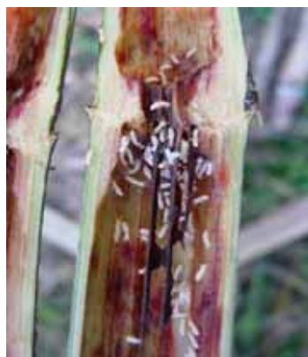
Figura 11. Termitas alimentándose del tejido de caña de azúcar. CENGICAÑA

Esto se muestra con tallos secos y ahuecados en cuyo interior puede observarse la presencia de termitas obreras y de tejido fresco (Figura 11) que al final termina con la destrucción total de los tallos, el tejido