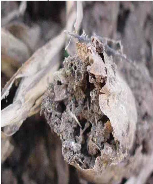
Figura 12. Destrucción total del tallo de caña de azúcar por termitas. CENGICANA

completamente seco y la presencia de tierra y heces (Figura 12). Un foco de alta infestación de termitas favorecida por altas condiciones de humedad en el suelo de caña de azúcar fue observado en Guanagazapa-Escuintla, provocando la muerte de todas las macollas (Figura 13).