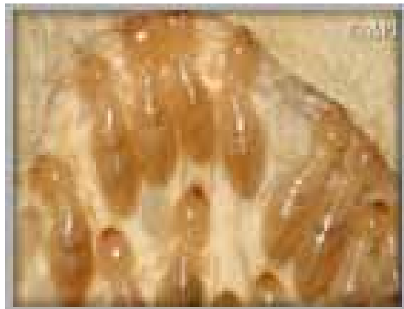
Figura 4. Termitas obreras.