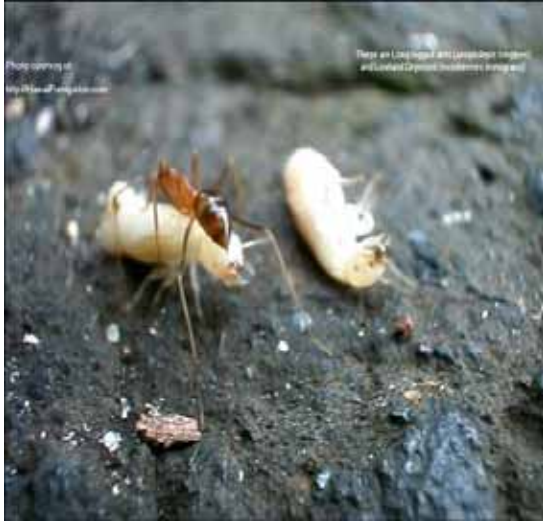
Figura 14. Hormigas depredando termitas.

Las hormigas como enemigos naturales (depredadores) que ocurren en los campos de caña puede ser un buen aliado en el control de las termitas subterráneas en aquellos ambientes de alta ocurrencia, debido a su agresividad y ventajas para moverse en ambientes abiertos, tal como se muestra en las Figuras 14 y 15.