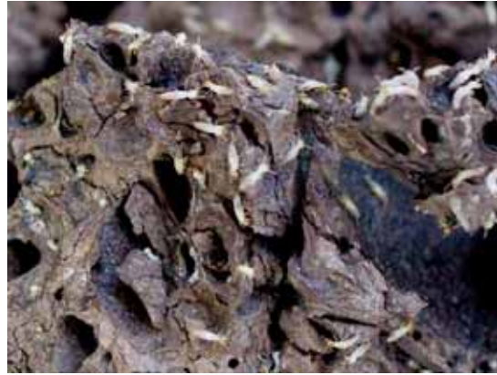
Figura 9. Túneles de termitas dentro del nido. CENGICAÑA