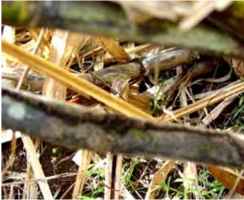
Figura 8. Túneles de comunicación elaborados por termitas en tallos de caña de azúcar. CENGICAÑA

Al final de un periodo de crecimiento, en el momento en que el esqueleto externo (cutícula) les queda pequeño, se desprende poco a poco y un nuevo caparazón más grande se forma inmediatamente. Este proceso se llama muda. Las termitas mudan aproximadamente una decena de veces antes de lograr su tamaño definitivo.