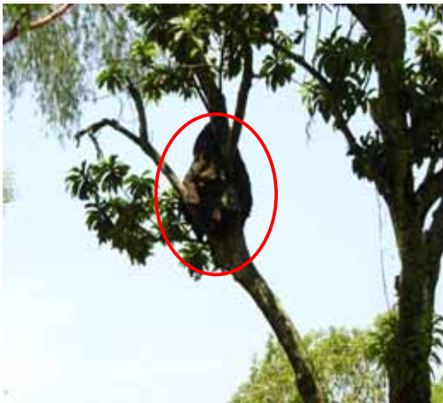
Figura 7. Termitero aéreo en linderos de caña de azúcar. CENGINCAÑA

Hay más de 2,600 especies diferentes de termitas reconocidas actualmente, sin embargo, esta diversidad puede clasificarse en 4 grupos distintos: 1) Termitas de madera húmeda, 2) Termitas de madera seca, 3) Termitas arbóreas o constructoras de montículos, y 4) Termitas subterráneas. Las termitas de madera húmeda tienen una distribución muy restringida ya que viven y se alimentan de madera muy húmeda, principalmente en troncos y árboles caídos en el bosque. Las termitas de madera seca son muy comunes en todos los continentes y no requieren el contacto con la humedad o tierra para su sobrevivencia. Las termitas constructoras son capaces de construir torres de tierra de 8 metros o más de altura y pueden ser tan numerosos que dominan el paisaje de algunas regiones en África, Australia, el Sudeste de Asia y partes de América del sur. Las termitas subterráneas, como su nombre lo indica, viven y se reproducen en el suelo, generalmente muchos metros debajo del mismo, aunque algunas también pueden construir nidos en los árboles u otras construcciones sobre el suelo (Figura 7). Estos termiteros aéreos deben tomarse en cuenta cuando se observen en los campos del cultivo de la caña de azúcar porque constituyen la evidencia clara de que en el futuro pueden iniciar la infestación del cultivo o bien ya está infestado.