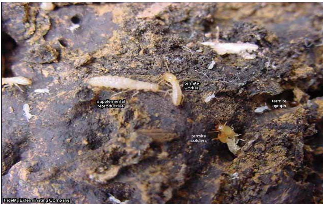
Figura 5. Castas comunes en una colonia de termitas.

Las termitas son las únicas entre los insectos sociales en donde los obreros pueden ser machos o hembras y algunos desarrollan alas y llegan a ser los más grandes en su estado de ninfa. Al final, estos obreros se desarrollan y llegan a ser alados completamente y se convierten en los futuros reyes y reinas de nuevas colonias. Estos individuos alados tienen variaciones en color desde negro a café pálido y alas de gris a negro. Bajo condiciones ideales se producen pocos individuos alados en la colonia, pero éstos constituyen el factor de dispersión de las termitas a los lugares no infestados. El enjambre de estos reproductores alados vuela una vez al año, generalmente después de las lluvias en el invierno y aunque tienen un vuelo muy débil, de corta duración y con una alta mortalidad entre ellos, los pocos que logran sobrevivir son capaces de formar nuevas colonias. Cuando observamos un termitero o colonia con detenimiento, podremos identificar las diferentes castas que ocurren, con excepción de los reproductores primarios, quienes están más profundos y no se exponen fácilmente (Figura 5).