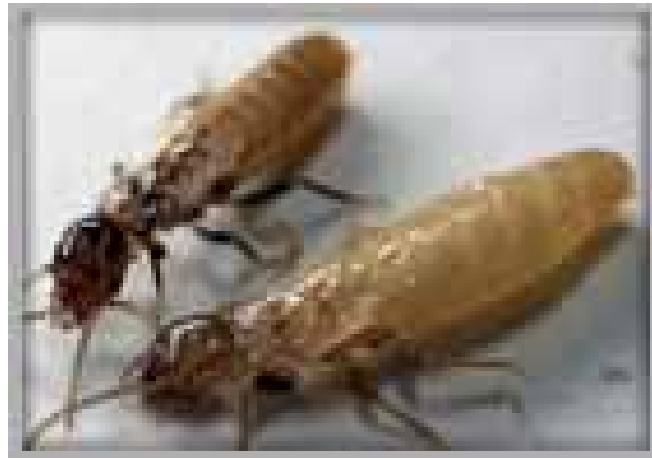
Figura 2. Reproductores secundarios de Termitas.

Dentro de los reproductores primarios, el individuo más grande es la reina , que no tiene alas, cuerpo de color oscuro y el abdomen de varios colores marrones (Figura 1). Su abdomen está hipertrofiado y abriga un aparato reproductor capaz de colocar miles de huevos hasta que una cantidad suficiente de obreros y ninfas se hayan producido para el cuidado de la colonia. La reina puede vivir varios años (a veces más de 10) y producir alrededor de 5,000 a 10,000 huevos cada año, sin embargo, no es capaz de desplazarse fácilmente y por ende de alimentarse, función que realizan las obreras. Al lado de la reina siempre se encuentra un rey (Figura 1) de cuerpo oscuro, capaz de moverse y que no ha perdido sus alas; ambos son responsables de la reproducción de la colonia durante su formación inicial. Cada colonia puede contener varios millones de termitas con la ayuda de reproductores secundarios (neoténicos), que también producen huevos y se caracterizan por tener en el dorso dos pequeños bosquejos de alas.