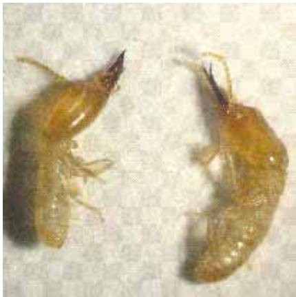
Figura 3. Termitas Soldados con mandíbulas en la cabeza. CENGICANA

Los soldados (Figura 3) son termitas que poseen una cabeza grande en donde se localizan dos poderosas mandíbulas y a quienes les corresponde defender la colonia contra insectos como las hormigas. La mayoría de individuos que componen la colonia son los llamados obreras (Figura 4), que no poseen alas y viven entre 1 a 2 años. Tienen coloraciones de blanco a crema y su función es la de emplear largas horas para atender a la reina, cuidar de los huevos, construir y mantener túneles y conseguir alimento para las larvas jóvenes.