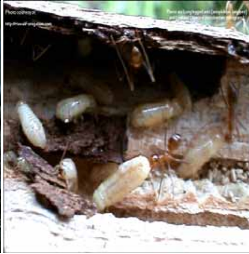
Figura 15. Invasión y destrucción del termitero por hormigas.