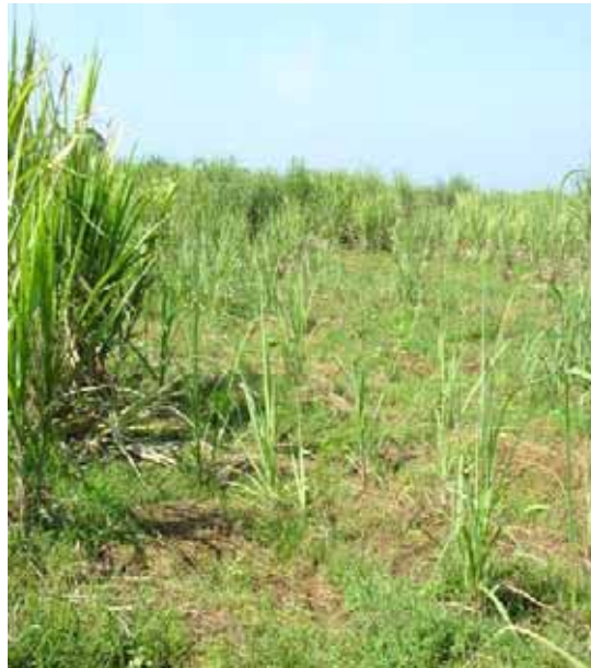
Figura 13. Mortalidad de macollas causado por termitas. CENGICANA